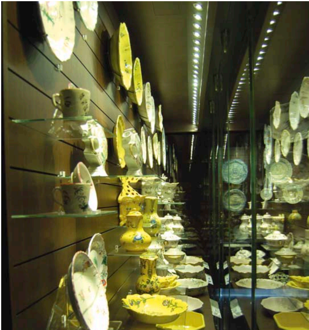
▲ Musée Sabatier d'Espeyran - Miniled ROA