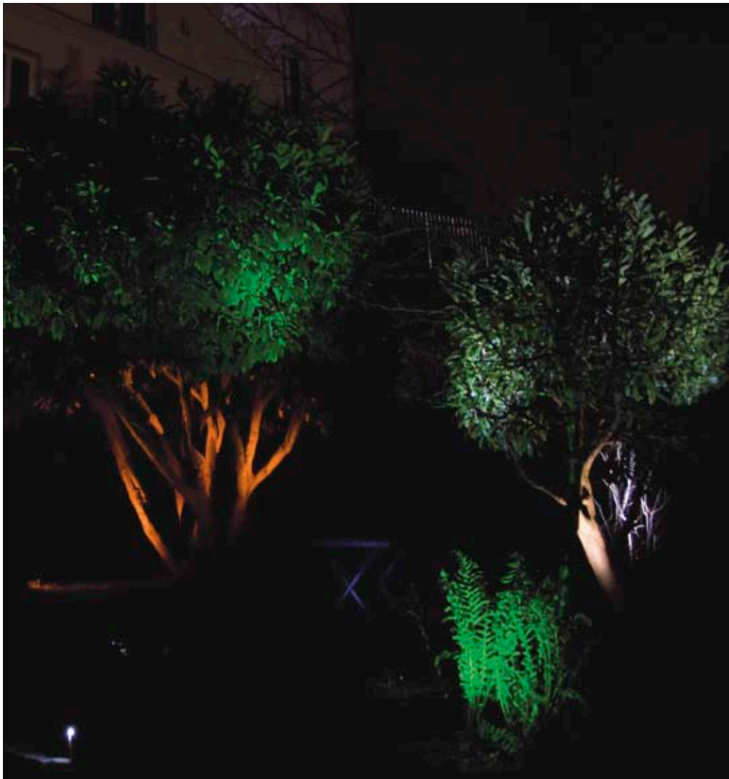
▲ Jardin Privé / Private Garden - Paris - Rolled