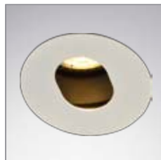
EO 500 SHANGRI-LA