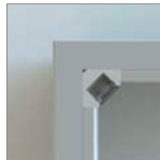
PROFILED ALU 45