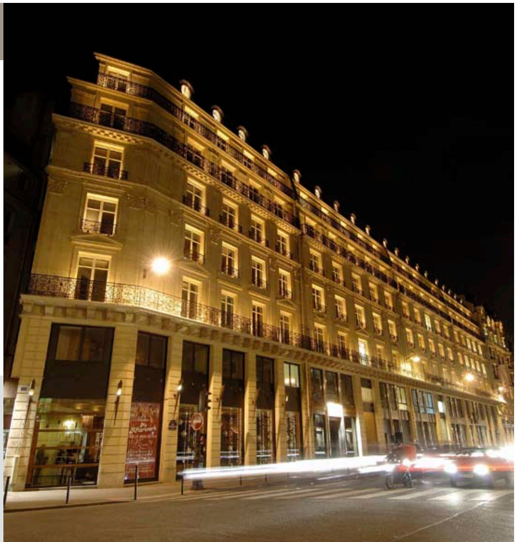
▲ Immeuble REAUMUR - Réaumur - Chromaled®