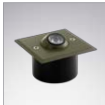
ROLLED SEMI ENCA