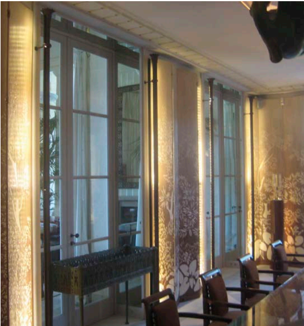
▲ Propriété Privée - Antibes - Fabrications sur mesure / Custom manufactured solutions