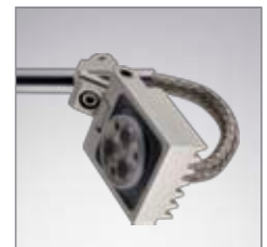
LUCIOLED Design Roger Narboni, Agence Concepto