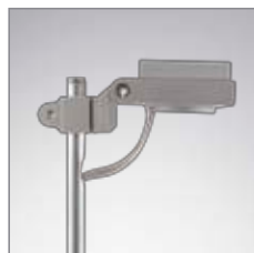
LUCIOLED Design Roger Narboni, Agence Concepto